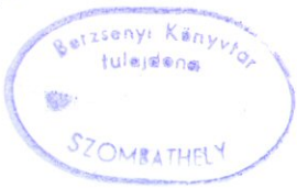
90/1712 Sylvester J. Ny.