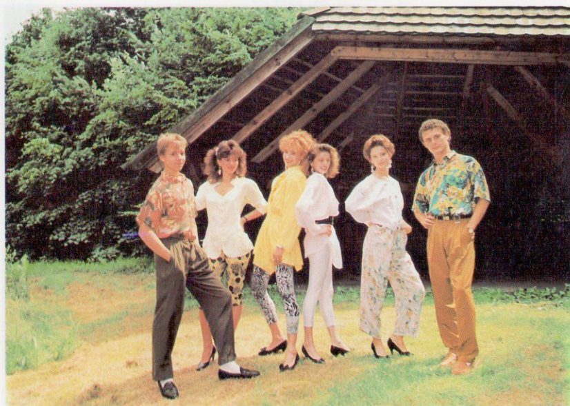
Szombathelyi Blue Dream Divatstúdió