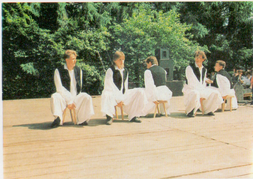
Óriszentpéteri Néptáncgyűttes fiúk