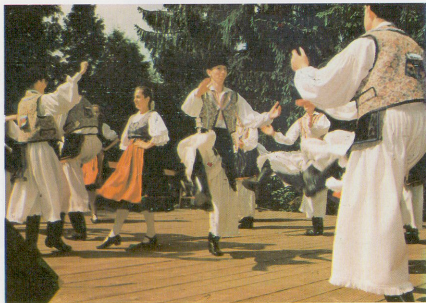
Körmendi Béri Balogh Ádám Néptáncgyűttes