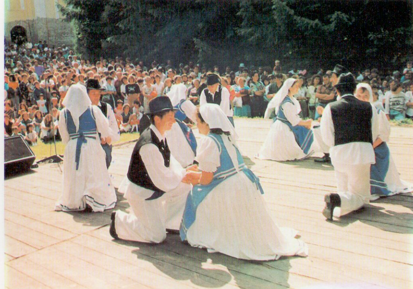
Felsőszölnöki Szlovén Néptáncsoport