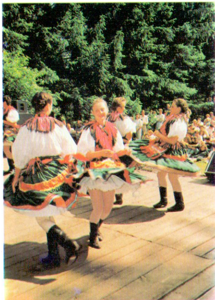
Óriszentpéteri Néptáncsoport lányok