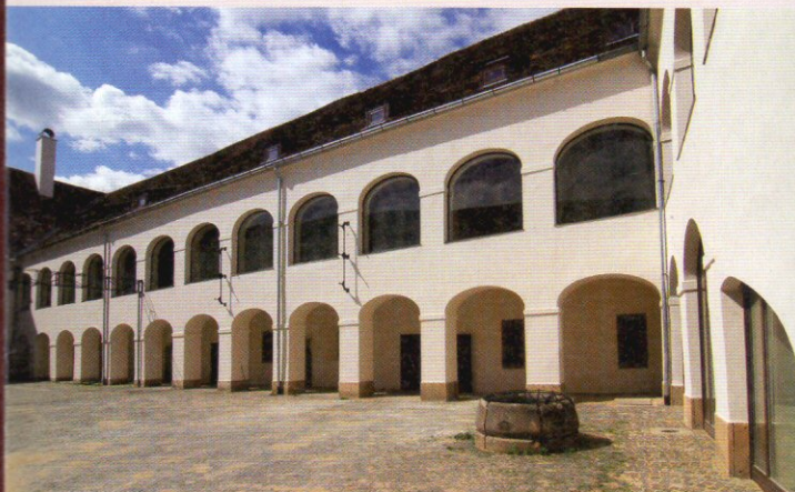
Dunántúli Kerületi Tábla (Rájinis J. u. 6.)

Az épületekben a falvakból beérkező terményeknek magtárákat, borospincéket, szénapajtákat alakítottak ki. A vár területén az uradalom ellátására istálló, sörfőzde, kocsmá, kovács- és bognárműhely működött. A személyzetnek szolgálati lakásokat is berendeztek. Itt lakott a tiszttartó, a kasznár, a hajdúk, a bognár, a cselédek, de a kéményseprő is.