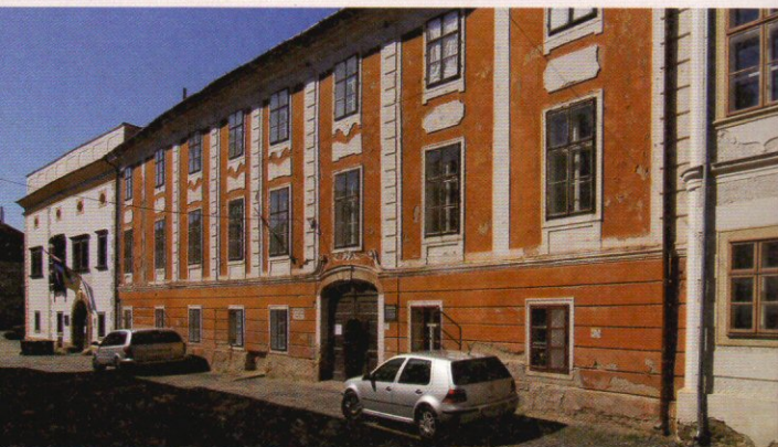
Táblaház (Schneller I. u. 3.)