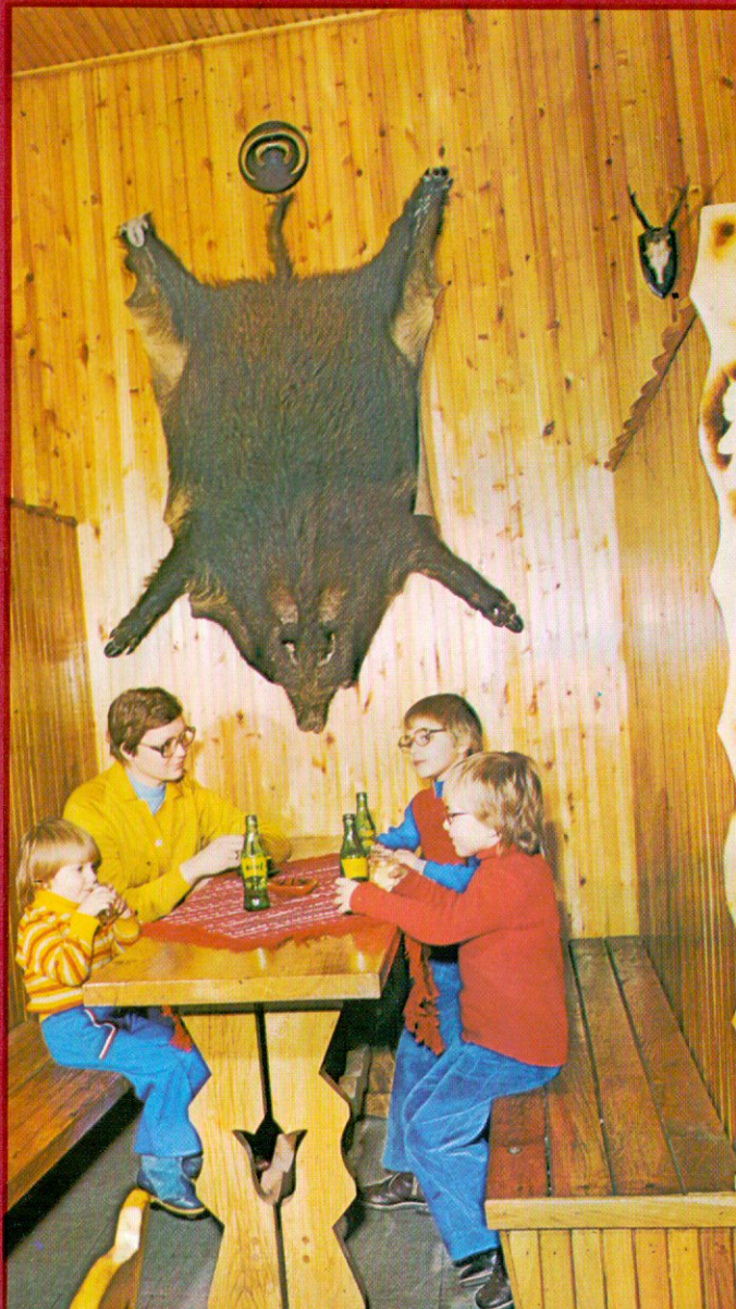
3. Órségi hangulat - Ländliche Stimmung Панорама края „Ёршиг”