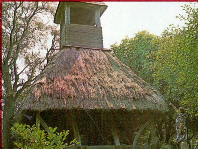
12. Szentgotthárd, műemléktemplom - Szentgotthárd, Kirche Baudenkmal - Сентготтхард, церковь-памятник архитектуры