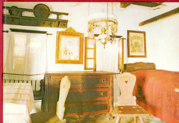
4. Szalafő, Pityerszer - Szalafő, Pityerszer (Etnographisches Freilichtmuseum) - Салафё, Питерсер