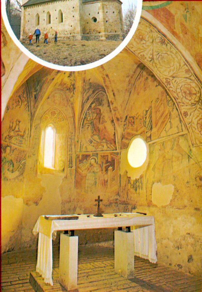
11. Velemér, gótikus templom - Velemér, Gotische Kirche Велемер, церковь в стиле готики