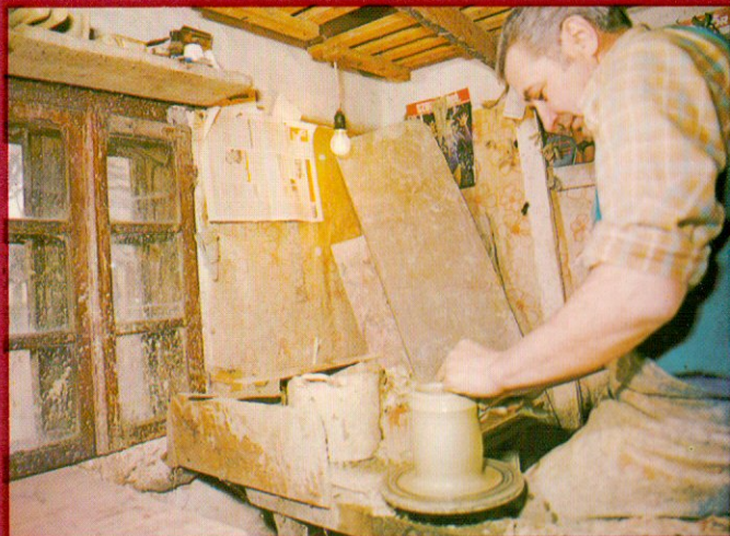
9-10. Órségi fazekas - Töpfermeister von Órség Мастер гончарного искусства края „Ёршиг”