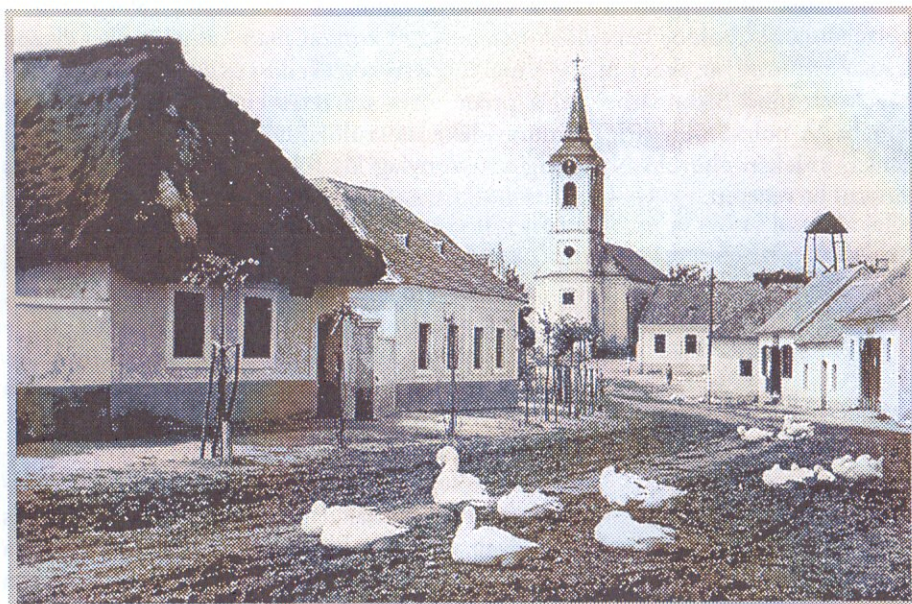
Nyőgéri utcaképzlet.