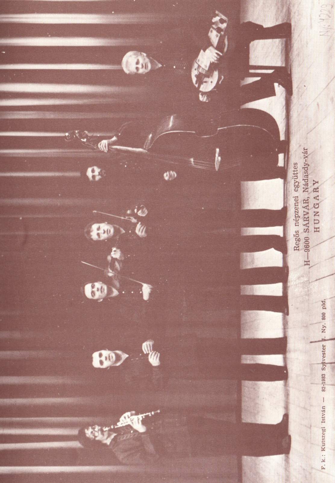
Regös népzenei együttes H-9600 SÁRVÁR, NÁDASDY-VÁR HUNGARY

F. k.: Kutszegi István — 82-1983 Szeptember 7. Ny. 800 pld.