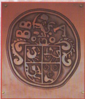
Béri Balogh Ádám pecsétnyomójának hiteles másolata

1710. okt. 29-én Szekszárd mellett, híres Murza lova a Cinka patak iszapjában összerogy alatta. A brigadéros a császári alakulatok összezúzott állapotban megtalálták és elfogták. A Habsburgok ismerve katonai tudását, próbálják az ő oldalukra édesgetni a hőst, de ő kijelenti, hogy nem lesz hazája árulója. A bécsi haditanács 1711. febr. 6-án Budán lefejeztette a kuruc kor legvitézebb alakját, Rákóczi hűségese alattvalóját Béri Balogh Ádámot.