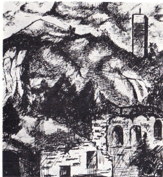
Kocz István: Ság-hegyi részlet (tus)

Kemenesaljai Művelődési Központ 9501. Celdömölk, Tanácsköztársaság tér Szerkesztette: Gaál Dezsőné Fotó: Bognár István Felelős kiadó: Szabó Árpád — 1973/5888 Vas m. Nyomda 200 pld.