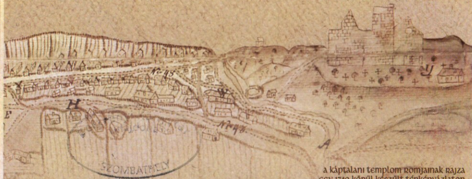
a káptalani templom romjainak rajza egy 1740 körül készült térkép vázlaton