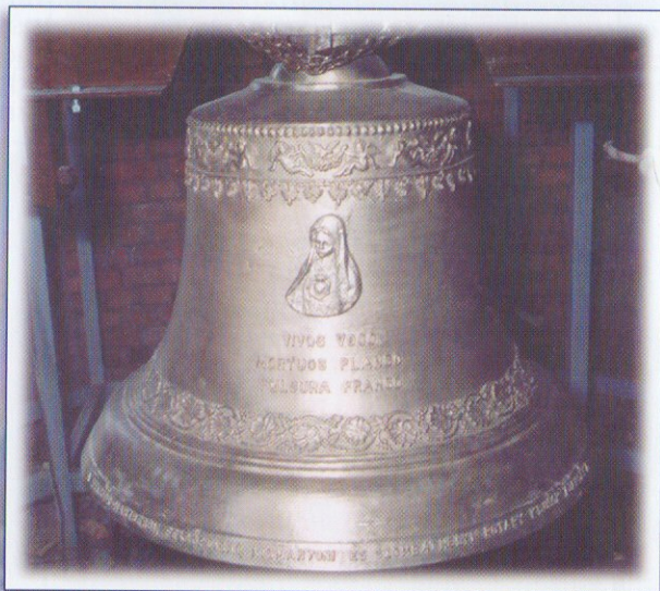
Az új Oladi Templom harangja

Megalakulásunk után az első nagyobb programunk volt egy allergia vizsgáló berendezés ajándékozása a Markusovszky Kórház részére. Ez a berendezés a fiatalkori allergia korai felismerését segíti, amelyet közösen vásároltuk meg az Angliában tevékenykedő RC East-hampstead segítségével, a Rotary-mozgalomban gyakori „Matching Grant” program pénzügyi konstrukciójában. Anyagi forrásainkhoz a Rotary International hozzájárult, de jelentős volt a magánszemélyek és vállalkozások részéről nyújtott támogatás is.