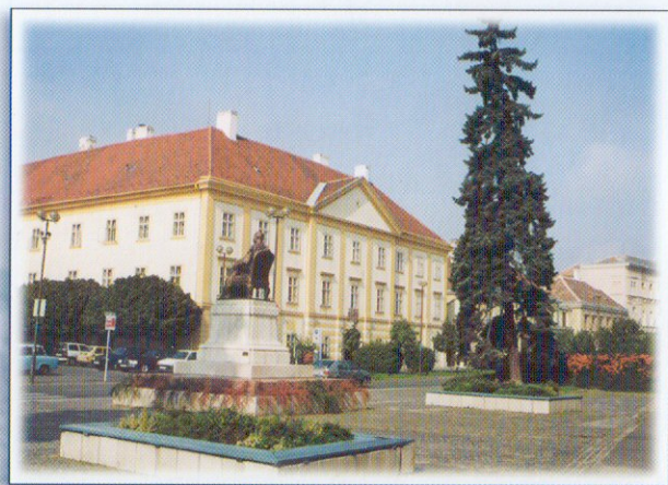
A Püspökvár Szombathelyen