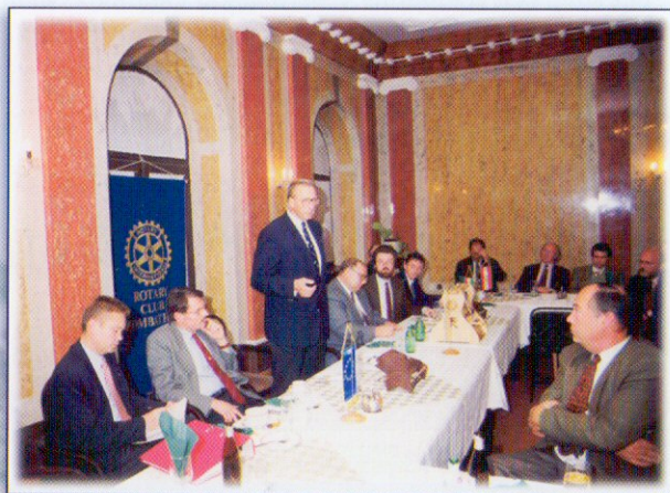
A Kormányzó és osztrák partnerklub látogatása Vasszécsényben