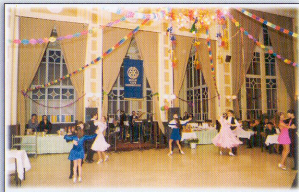
Táncosok bemutatója hagyományos Rotary-bálunkon

Az újjáalakulás óta eltelt időszak eseményeit nehéz röviden összefoglalni. Energiánkat és anyagi eszközeinket arra összpontosítottuk, hogy a környezetünkben lévő rászorulóknak segítséget tudjunk nyújtani. A klub rendszeres tevékenységét ezért különböző rendezvényekkel is bővítettük, amelyek ismertté tették a Rotary eszméit, célkitűzéseit. Az adományozások a klub anyagi eszközeit kiegészítve segítették karitatív tevékenységünket.