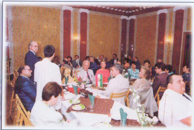
Angliai testvérklubunk tagjaival Vasszécsényben

Munkánkat nem tudnánk ilyen eredményesen végezni, ha családtagjainktól a kezdetektől fogva nem kapnánk állandó segítséget és biztatást, az ő áldozatos munkájuk is ott van minden megvalósított cél mögött.