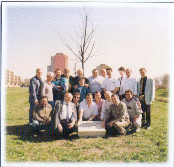
Rotary fasor ültetése Szombathelyen

A klub tevékenysége és kapcsolatai révén a világ is kitérült előttünk. Klubtagjaink a világ számos részén találkoztak rotarysta barátokkal, részt vettünk különböző Rotary-klubok rendezvényein.