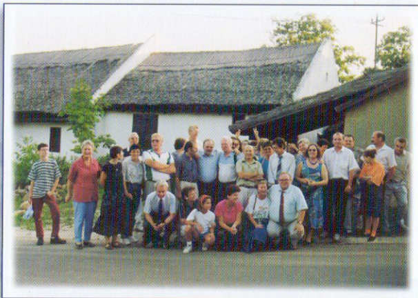
Az angol partnerklub látogatása - ismerkedés a magyar Rotary-élettel és a balatoni borokkal