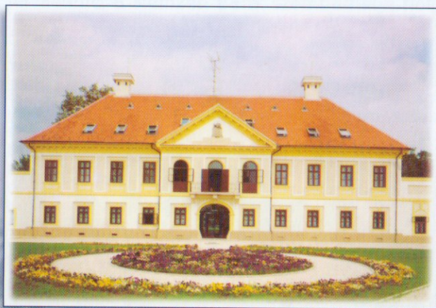
Az Új-Ebergényi Kastélyszálló Vasszécsenyben