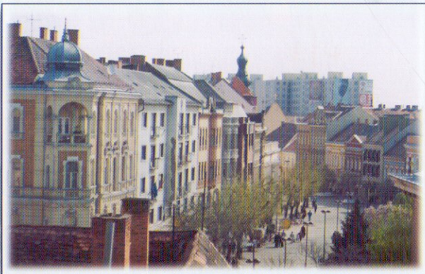
A szombathelyi Fő tér