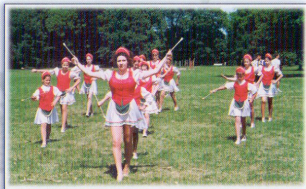
Mazsorettek a Rotary -majálison

Évente ismétlődő rendezvényünk az időjárástól függően egy júniális vagy majális megrendezése az Új-Ebergényi Kastélyban. Erre az eseményre a felnőtteken kívül gyerekeket is meghívunk, azért hogy a jövő nemzedéke minél korábban találkozzon e karitatív tevékenységgel.