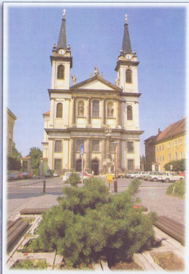
A szombathelyi székesegyház

This year's membership of 30 represents professions and trades of 27 types.