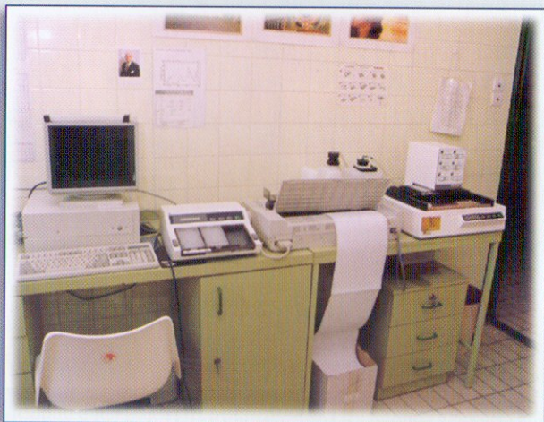
Első nagyobb adományunk a Kórház részére allergia vizsgáló készülék

A következőkben legjelentősebb programjainkról ejtünk néhány szót.