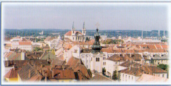
A város madártávlatból

It was the collectively performed philanthropic needs that have deepened the friendship and the tolerance both to one another in the club and to others. Friendly relationships have been formed with a number of European and Overseas clubs.