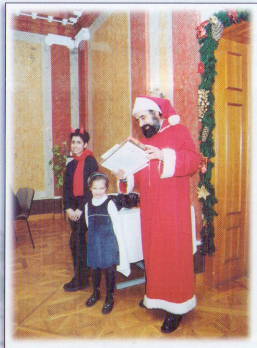
Trefás Rotary-Mikulás ünnepség a klubban

Családtagjaink a munkán kívül közös rendezvényeinken is részt vesznek. Minden évben egy közös családi rendezvényen a „Rotary-Mikulás” trefás keretek között ajándékozzuk meg egymást.