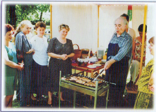
Alapító elnökünk asszonykoszorúban egy júniális alkalmával

Természetesen e két jelentős, évente ismétlődő esemény mellett számtalan alkalmi rendezvényt is tartottunk.