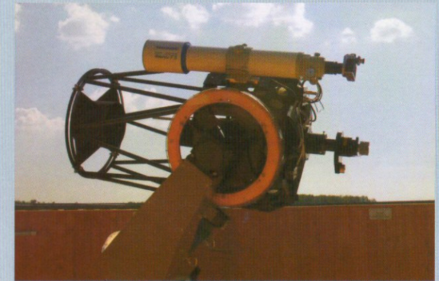
Az 50 cm-es Ritchey-Chretien teleszkóp