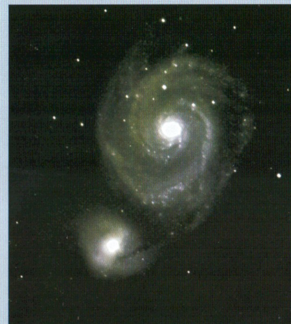
Messier 51 (Örvény köd)