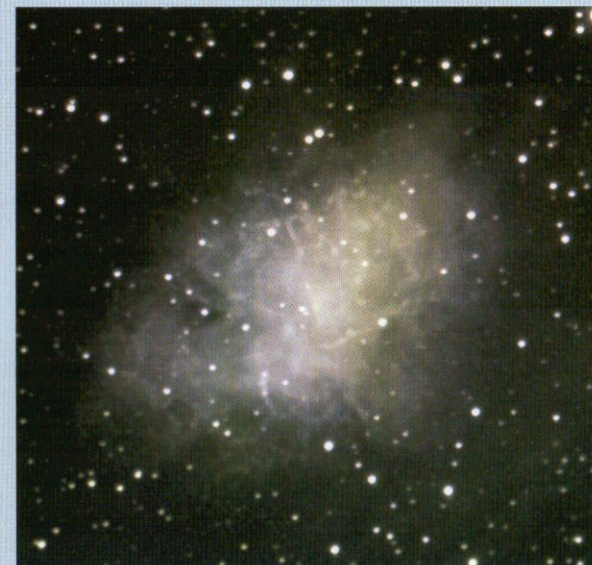
Messier 1 (Rák köd)