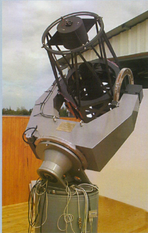
The 50 cm Ritchey-Chretien telescope

Funds for the 50 cm RC instrument are from the PHARE CBC project.