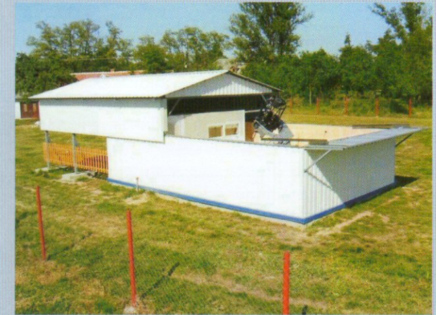
A letolható tetejű csillagvizsgáló