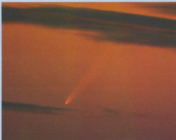
2006P1 McNaught üstökös

Gyártók: Optika Marcon (Italy), mechanika Gemini (Hungary)