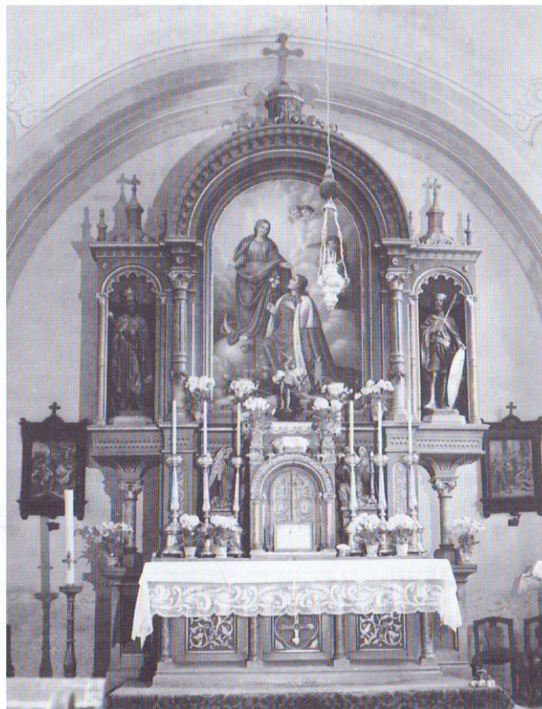
Az 1906-ban épült főoltár

A plébániatemplom térszomszédságában lévő egyházi ingatlan – hajdani iskolaépület – ma a Dr. Lenarsich Imre Helytörténeti Alapítvány székhelye, a község kulturális örökségének, muzeális értékeinek gyűjtőhelye.