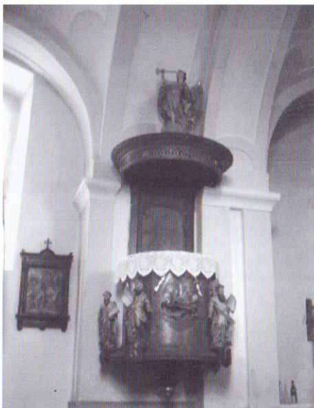
A copf stílusú szószék XVIII. századi alkotás