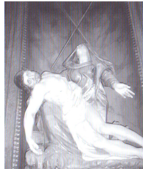
A Szent Sír-oltár Pieta szobra