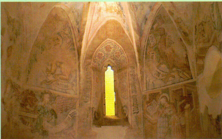
Nemzetközi hírv freskók az Árpád-kori veleméri templomban