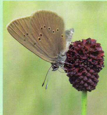
Zánót-hangyaboglárka őszi vérfűn

A domboldalak extenzív kaszálógyümölcsösöknek adnak otthont. Ezek olyan régi, hagyományos gyümölcsfajtákat őriznek, mint a búza-ér szilva, a zab-ér körte, a pogácsalma és a tökalma. A gyümölcsök egy részét aszalták, lekvárt főztek és pálinkát is készítettek belőlük. Az őrési emberek a gazdálkodás mellett az erdei melléktermékeket, a gombákat, az erdei gyümölcsöket, a mézet és a gyantát is természetesen hasznosították. A nemzeti park több mint száz helyi fajtából álló gyümölcsöskertet, fajtagyűjteményt hozott