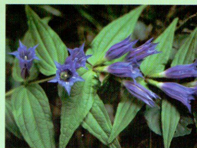
Lomb- és tűlevelű erdők növénye a fecsketarjics

Az Őrség és a Vend-vidék madárvilágának érdekessége a hegyvidéki, illetve északi fajok dombvidéki előfordulása. Számos hegyvidéki faj – a süvöltő, a csíz, a búbos cinege, a kormosfejű cinege, a hegyi fakusz, a kis légykapó, a hegyi billegető, az erdei szürkebegy – gyakran kerül szem elé. A két királykafaj fészkelése az Alpok közelségét jelzi. Bizonyos fajok, mint a közép fakopáncs, a fülemüle és a rövidkarmú fakusz, az Alpok lábánál érik el elterjedésük nyugati határát.