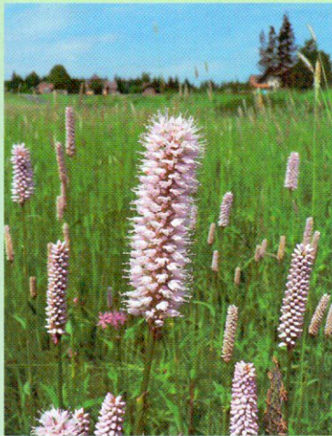
Üde lápréteken virít a kiggyókerű keserűfű

kozottan védett emlőse a vidra , legzetes nyomait a Rábánál, a Kerkánál és a Vadása-tónál mindig megtalálhatjuk. A térség állattani értékét növeli a Rába kavicszátonyain, szigetein fészkelő kis lile és billegető cankó .