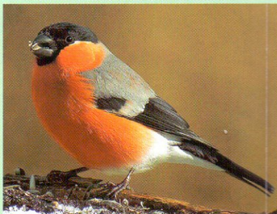
Meggypiros mellényéről könnyen felismerhető a süvöltő

dett érték a rózsaszínű nedűgomba . A gyepterületeken gazdag rovarfauna él, sok lepkefajjal.