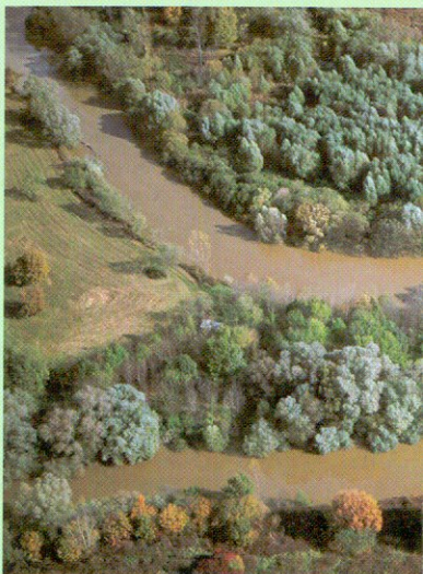
A kanyargó Rába

Nyugati alfajként az Őrségben jelenik meg először a kormos varjú. A déli elterjedésű füleskuvik felbukkanását valószínűleg a szlovén állomány terjeszkedése magyarázza. A bükkösökben fekete harkály és kék galamb költ, az Őrségi elegyes erdőkben országosan is számottevő a sajtósan táplálkozó darázsölyv állománya. Az idős, elegyes erdőkben az embertől távol költ a fekete gó-