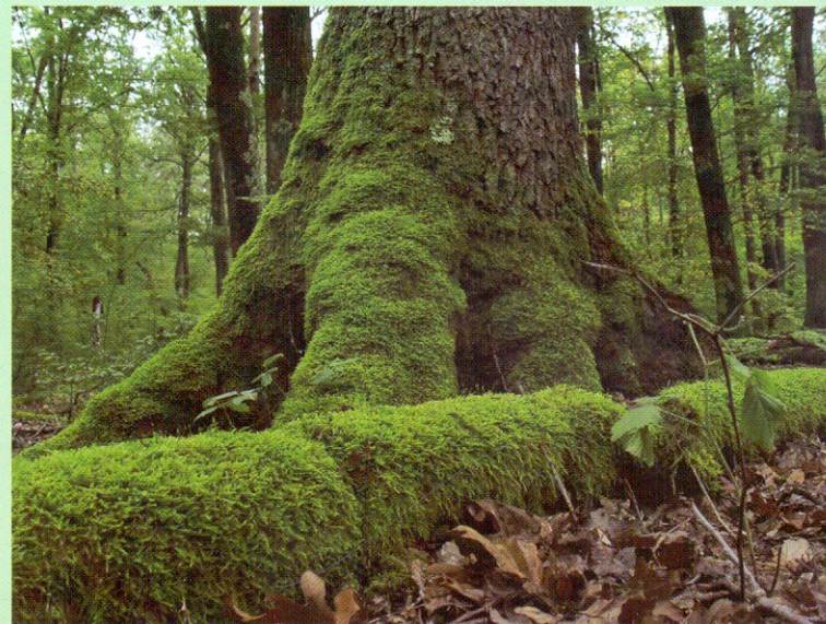
Életkép az őserdőben

A vegyszerhasználat nélkül művelt idős gyümölcsfaligetek kitűnő élőhelyei számos odúlakó madárfajnak. Itt költ a füleskuvik , a búbos ban-