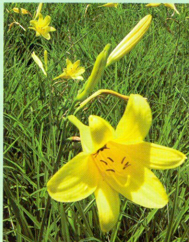
Lápréteken él a szépséges sárgaliliom

lya. A gyakoribb zöld küllő mellett tekintélyes állománya él itt a szürke küllőnek, amely az Őrség Különle-