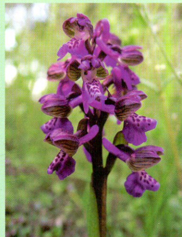
Már áprilisban hozza virágát az agárkosbor

létre az eltűnőben levő hagyományos gyümölcsfajták megmentésére.