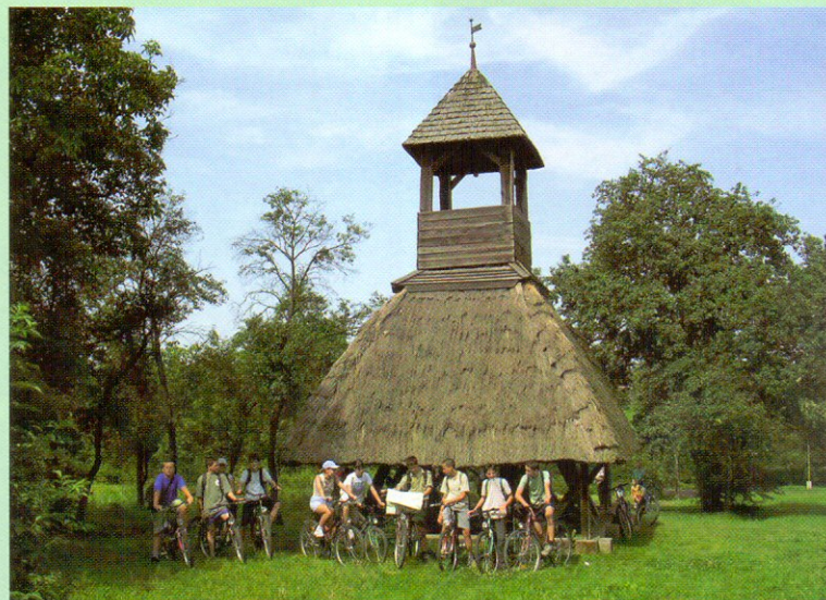
Kerékpárosok a pankaszi haranglábnál

A résztvevők betekintést nyerhetnek a Szala-völgy élővilágába, megismerhetik a hagyományos őrségi háziállatfajtákat, valamint a Pityerszeri Népi Műemlékegyüttes értékeit. A túra során kuriózumot jelenthet a kecskesajt megkóstolása és a tökmagolajütés archaikus módszerének megtekintése.