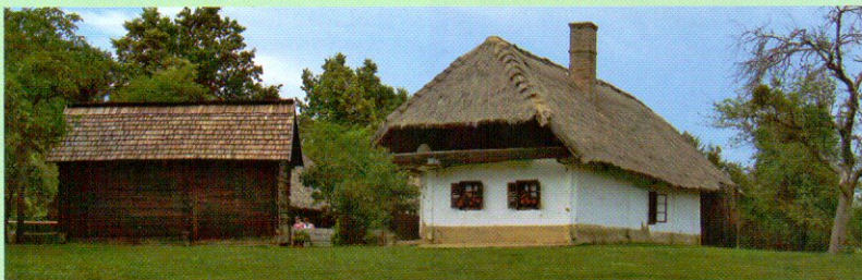
Népi műemlék lakóház Szalafő-Pityerszeren

A régi hagyományos őrségi, vend-vidéki, hegyháti, hetési és göcseji parasztporták képéhez hozzátartozott a házakat körülvevő gyümölcsös, valamint a házaktól távolabb, a meredekebb domboldalakon kialakított kaszálógyümölcsös, amely tág hálózatban álló fáival mindmáig a tájkép egyik jellegzetes alkotó-eleme.