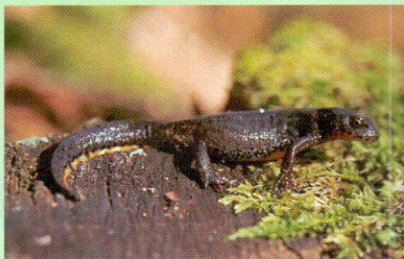
A Vend-vidéken található hazánk egyik legnagyobb alpesigöte-állománya

A domboldalakon fajokban gazdag, száraz hegyvidéki jellegű kaszálórétek találhatók. Itt él a védett agárkosbor , a sömörös kosbor , a szártalan kankalin , a kígyónyelv , a szártalan bábakalács , az őszi füzértekerics és a krajnai pacsirtafű . A virágzó réteken ritka, védett gombafajok fordulnak elő, jelezve a terület hagyományos (külterjes) művelését, szennyezésmentes állapotát. Kiemelkedő vé-