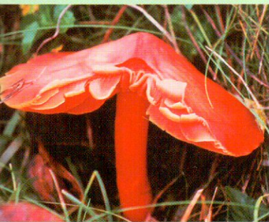
Ritkán kerül szem elé a pompás nedűgomba

Az őrési táj jelenlegi képének kialakulásában fontos szerepet játszott az önellátó, természetközeli kisparaszti gazdálkodás. A terület természeti adottságai elsősorban az állattenyésztésnek és az erdőgazdálkodásnak kedveztek.