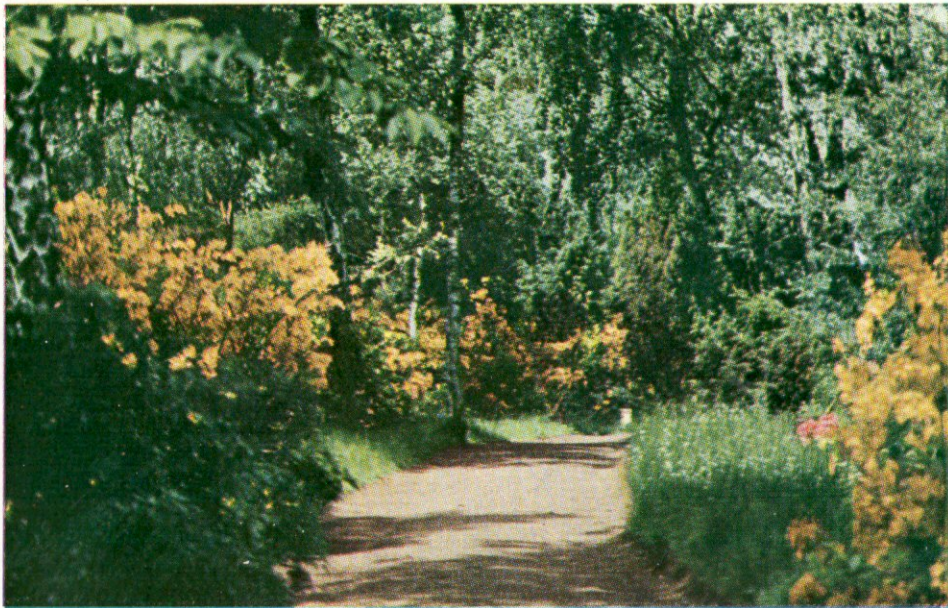
Részlet a Jeli arborétumból