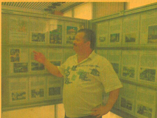
Egy kiállításon, a sok közül

A múzeumot 2001 július 7-én nyitottam meg, a 31 éves gyűjtőmunkám bemutatása, közkincsé tétele céljából. Távlati cél, hogy a világon kiadott lapokból 1-1 darab megtalálható legyen. Igaz ez hiú ábránd, hiszen lehetetlen, de törekedni kell rá.