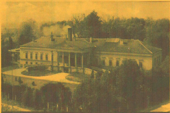
Kastély épület, ma Időskorúak Otthona

2001-ben létrehoztam a Képeslap Múzeumot Hegyfalun, s 2003-ban alakult meg a Képeslap Múzeum Baráti Kör, melynek két fő feladata van. Egyik, hogy elősegítse a Múzeum fejlődését, hivatalossá válását, a másik, hogy az országban élő gyűjtőtalálatokat összefogja (korra, nemre, gyűjtemény jellegére, nagyságára való tekintet nélkül).